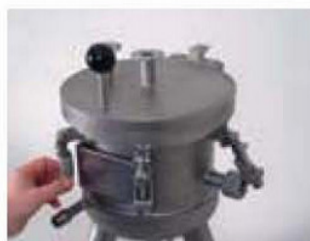
クランプスクリュー機構で簡単な開閉