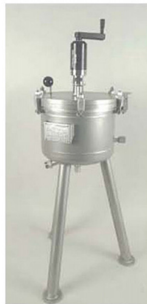
ハンドスターラー