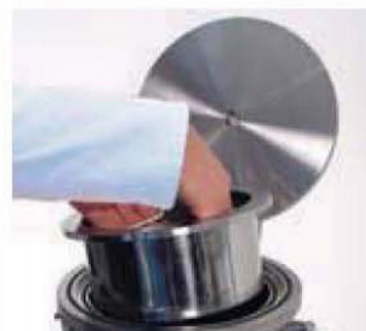
フィルターバスケットの簡単な装着