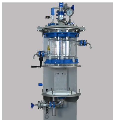
フィルタープレートの下降 フィルターの交換 / 清掃