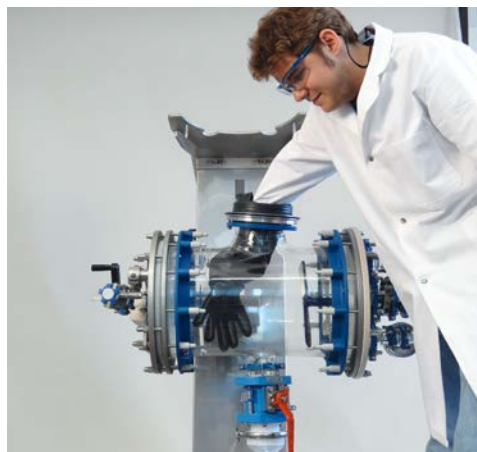
安全にフィルターケーキを取出す、封じ込めシステム