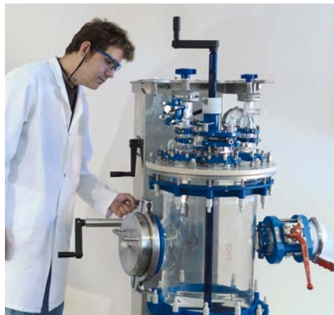
油圧バルブによる、容易な容器の下降

多機能の架台は、フィルター交換・装置クリーニングの為に下降します。 また、フィルターケーキの容易な取出しのために回転もします。 これは、短い時間においても、高費用効果をもたらせます。