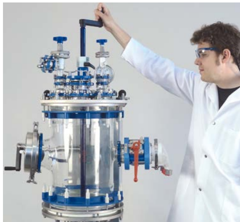
高さ調整可能な、グラスライン製スターラー

高活性の試薬・製品は、耐腐食性の製品で取扱われます。 これは、作業者のプロセスにおいて安全で、安定している環境を 提供します。