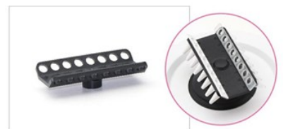
0.1 or 0.2ml PCRチューブ用