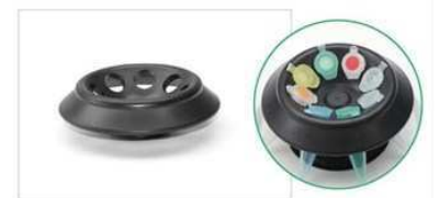
1.5 or 2ml×8本用ローター