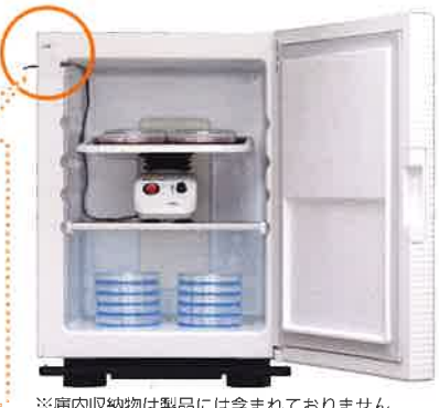
※庫内収納物は製品には含まれておりません。